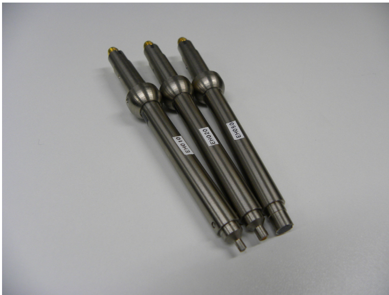
電界プローブ外観