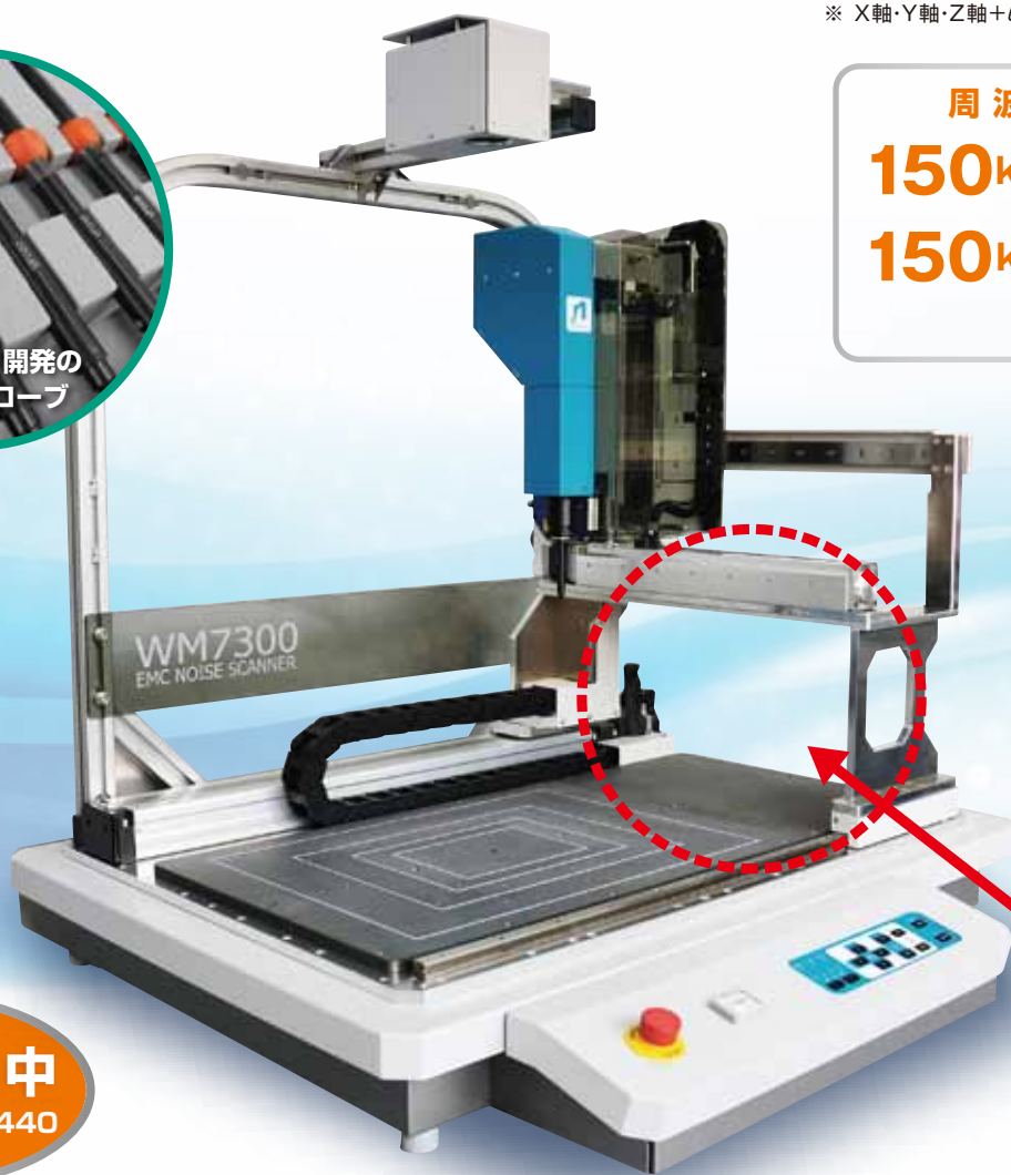
ここがポイント! 吹き抜け構造

周波数帯域 150kHz~3GHz 150kHz~8GHz CISPR22 対応