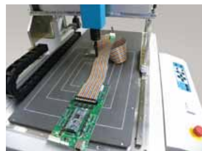
長尺ものを突き出した状態で測定可能

最大A3 (W420×D297×H200mm) までの対象物を一度に測定可能。測定台の奥側に遮蔽物のない「吹き抜け構造」を採用し、長尺ものの対象物でも余裕で測定ができます。