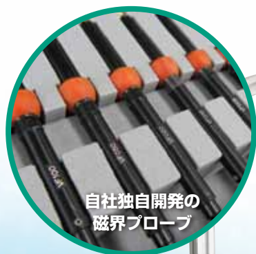
自社独自開発の 磁界プローブ

周波数帯域 150kHz~3GHz 150kHz~8GHz CISPR22 対応